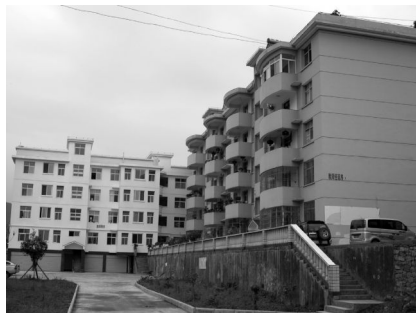
图 3 新建的教师经适房和周转房