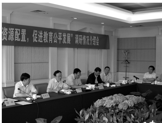
图1 调研组听取汇报

6月初,由蒋树声主席率队,张宝文、索丽生、陈晓光等副主席及部分盟内教育专家参加的民盟中央2012年重点课题调研组一行奔赴湖北省,就“统筹教育资源配置,促进教育公平发展”课题进行专题调研。调研组听取了郭生练副省长代表湖北省政府所作的专题工作汇报,并分两个小组赴武汉、黄冈、恩施等地实地考察,取得了丰硕的调研成果。我参加了索丽生副主席率队的第二小组,在恩施州及下辖利川市、恩施市等地进行调研考察。一路走来,感触颇多。既看到了推进教育公平的希望,也看到了面临的严峻挑战。