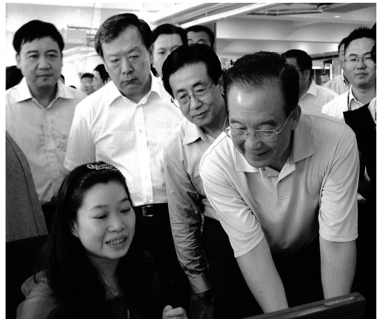
上图为温家宝在企业调研

在网易公司,温家宝和一线员工亲切攀谈,仔细询问来自哪里、工作年限、从事工种等。听说企业今年新招收大学生700余人,既有来自甘肃等中西部地区的,也有来自广东等东部沿海地区的,温家宝说,只有广聚人才,企业才能发展。企业要发展得好,既需要负责人经营管理好,也需要广大职工的辛劳付出。