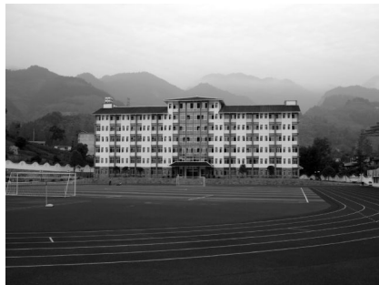
图 2 大山中的学生公寓

反映教育不公平的第二层次的问题,即国际教育界经常讨论的“关系不平等”问题(inequality in relationship)。对于我们这样一个外出务工人员达到 2 亿多、各地都存在大量留守儿童的国家,这一问题显得更加突出。众所周知,相对于儿童的成长而言,重要的不仅是学校环境,还有各种人际关系。总体而言,单亲家庭、问题家庭、弱势家庭、困难家庭,或者说缺乏完整正常人际关系的家庭环境,是不利于儿童身心健康成长的。据湖北省的一项调查统计,随外出打工父母四处奔走的义务教育阶段学生中,超过五分之一感到学习有困难,其重要原因就是这些学生得不到稳定的、持续的和适当的身心关怀与家庭教育。我们所调研的利川民族实验中学是一所以招收农民工随迁子女为主的初级中学,全校 1624 名学生中,农民工随迁子女就有 823 人,占学生总数 51.2%。其中属于父母在外务工的留守学生就有