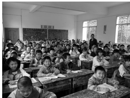
图 4 某小学六年级 87 名学生大班上课