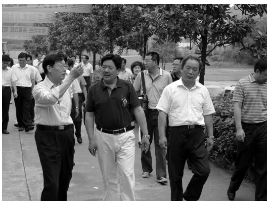
图5 中央统战部朱维群常务副部长(前右2)与调研组一起考察民办学校

223人,占学生总数的13.7%。我不知道恩施全州、湖北全省乃至全国有多少留守儿童,想必一定是一个庞大的数字。如何让他们还有那些数字更加庞大的农民工随迁子女获得有利于身心健康的人际关系环境,是摆在政府、教育工作者和全社会面前的一项艰巨任务。好在虽然针对这一难题的政策措施出台缓慢,许多学校都在努力做出各种安排,创造美好人际关系,帮助学生度过心理难关。利川民族实验中学就专门建立了“心灵驿站”,每天下午安排老师值班,帮助解决学生的思想和心理问题。我不知道心灵驿站建立的实际成效如何,但这一制度的建立仍使我感动,让我看到了基层学校为弱势学生心理健康所作出的努力。