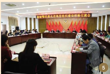
图 5 10月25日至26日,浙鄂皖民盟先进基层组织建设经验交流会在安徽举行。