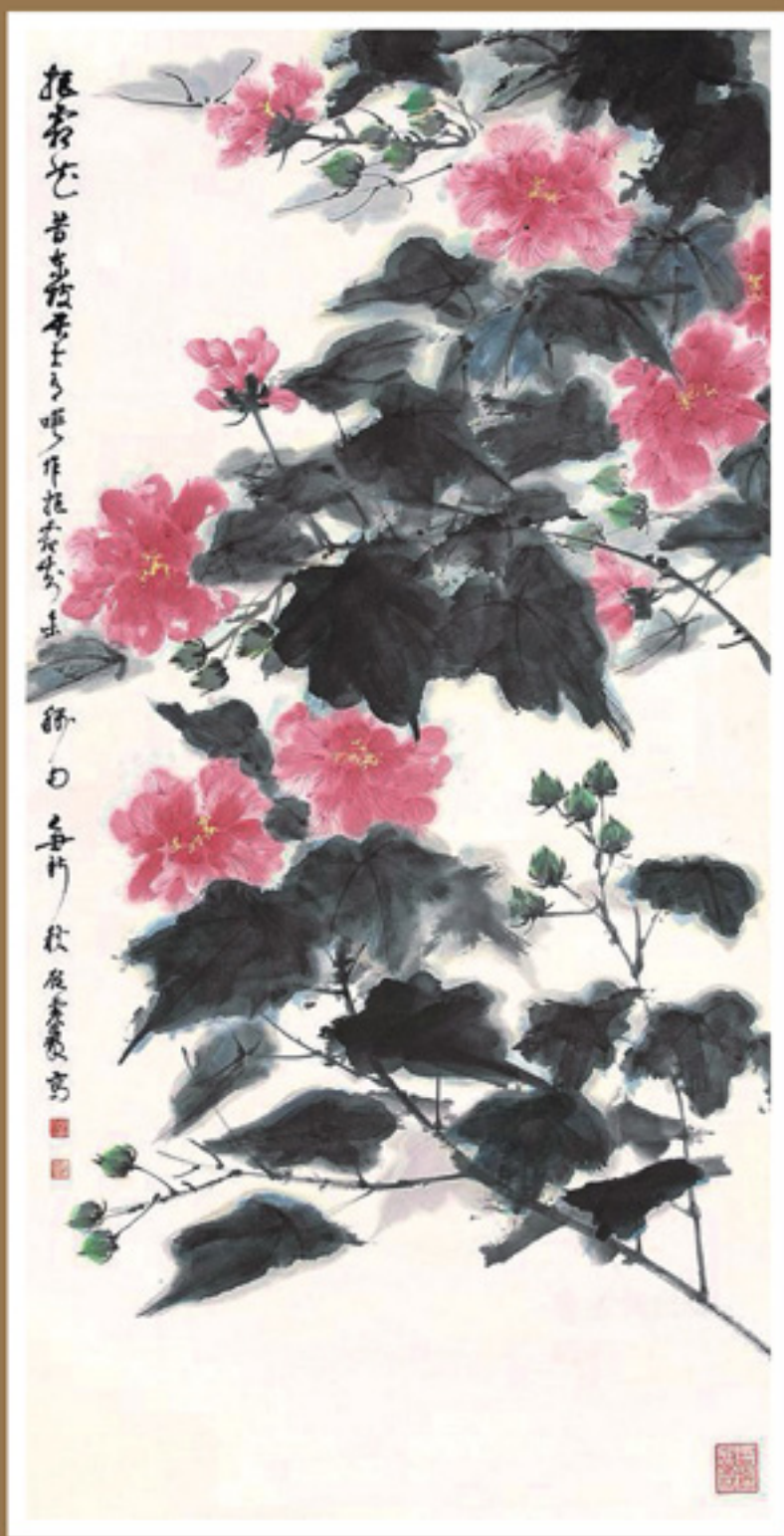
《拒霜花图轴》 顾震岩 民盟浙江华夏书画学会副会长