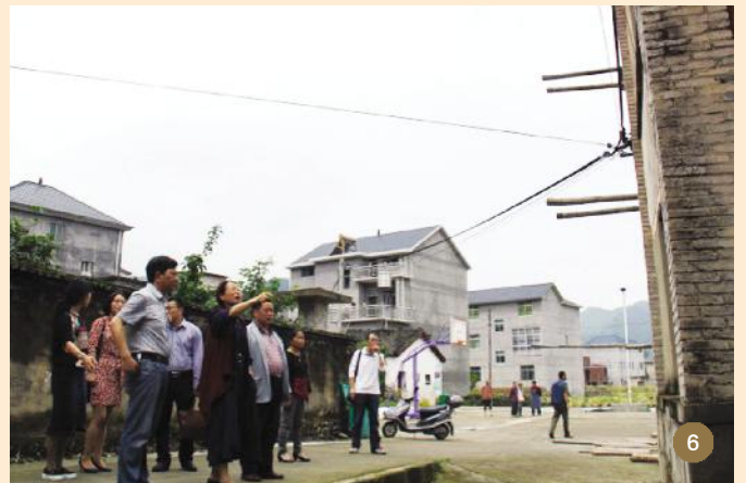
图 6 5月17日,民盟省委会红十字烛光博爱专项基金项目考察组就开化县霞光村文化礼堂建设(避灾所)项目开展情况考察。

图 5 5月12日,民盟松阳县医卫支部赴该县中心敬老院开展“献爱心、送健康”活动。